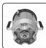
Juego mecánico 100% refabricable.