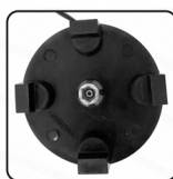
Corona de polipropileno de alta densidad.