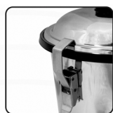
Broche de acero